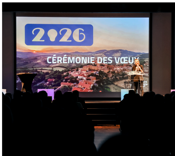
Cérémonie des vœux 2026