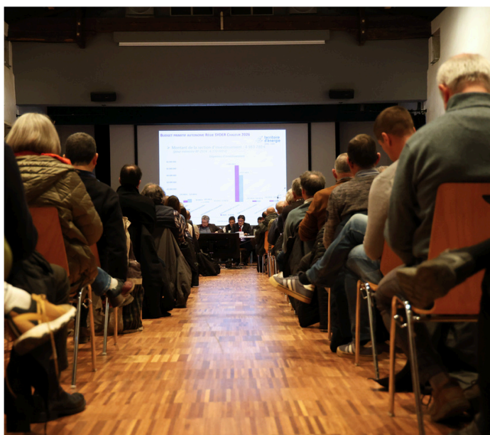
Premier comité syndical de l'année 2026