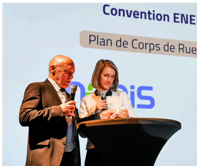
Signature de la convention ENEDIS / SYDER pour le partage du Plan de Corps de Rue Simplifié (PCRS)