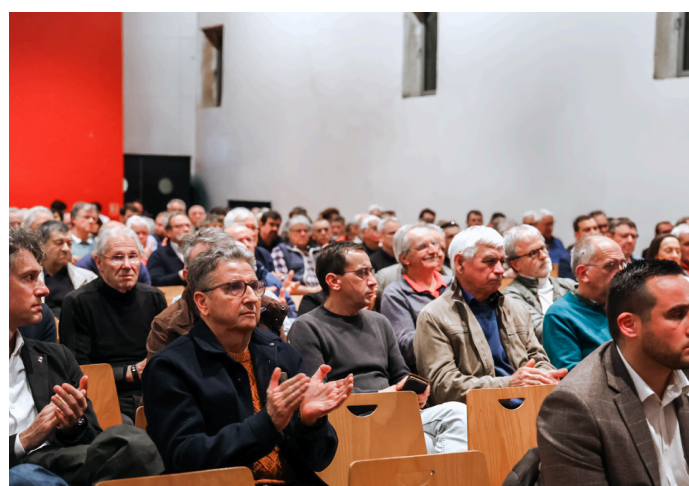
Près de 250 élus, entreprises et partenaires ont répondu présents