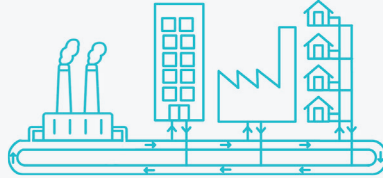
Réseaux de chaleur